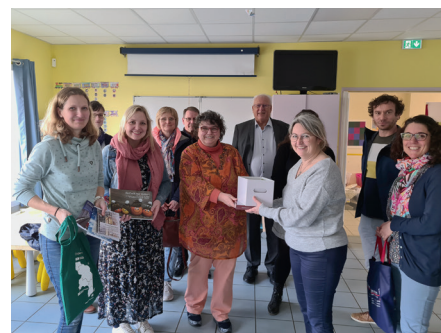
Projet d'échanges scolaires : rencontre entre l'équipe de l'école Saint-Jean-Bosco et la délégation allemande