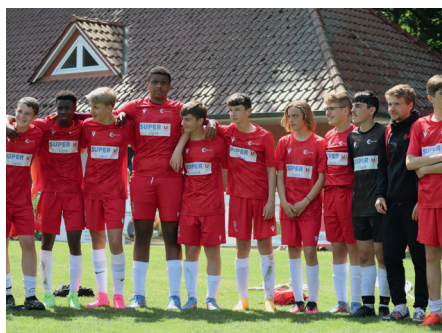
Équipe des U15 du Cellier au Tournoi International 2023 à Vechta-Langförden